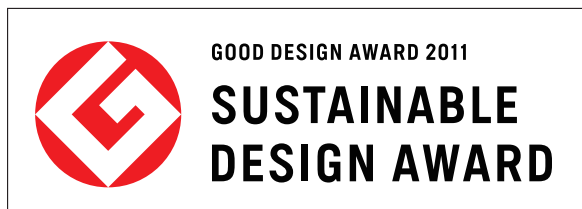
サステナブルデザイン賞だけの特別ロゴマーク 今年の選出はわずか5作品という、貴重な賞です

サステナブルデザイン賞とは、「地球環境問題を踏まえ、持続可能な社会の実現をめざしている」と認められた作品だけに贈られる特別賞。審査員からは、「人間と自然の共生、森林保全と斜面防災の両立ができる方法である」と、高い評価を頂きました。