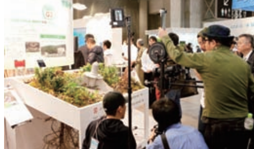
ノンフレーム工法展示ブースは、テレビ取材を受けるほどの盛況ぶりでした