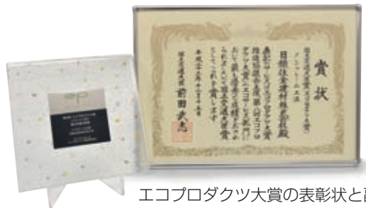
エコプロダクツ大賞の表彰状と副賞の楯