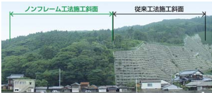
樹木を活かせるノンフレーム工法は、社会のニーズに応える工法として、高く期待されています