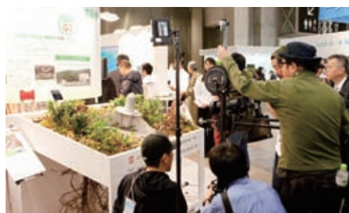
ノンフレーム工法展示ブースは、テレビ取材を受けるほどの盛況ぶりでした