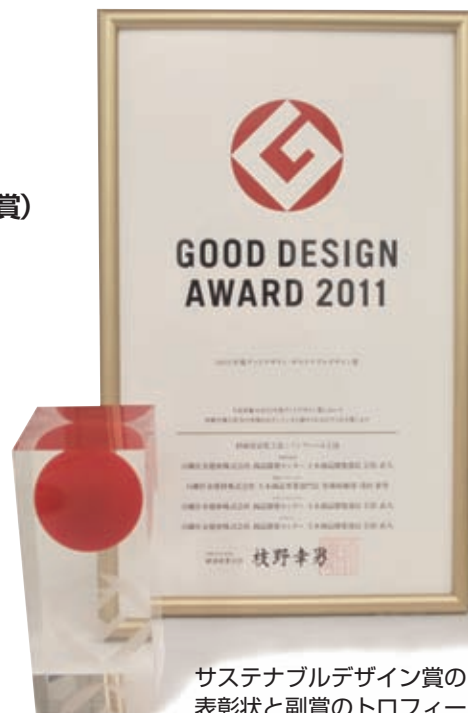
サステナブルデザイン賞の表彰状と副賞のトロフィー

ちなみにこれまでに、グッドデザイン賞特別賞とエコプロダクツ大賞の両方を受賞した製品は、 トヨタ・プリウス （ハイブリッド車）や 日産リーフ （電気自動車）など、革新的技術で卓越した環境性能を実現したものばかり。ノンフレーム工法もこれらに並ぶ画期的な斜面防災技術として、高い評価を頂きました。